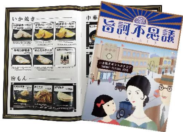
旨訶不思議 公式ホームページ